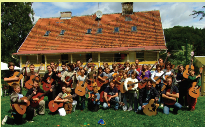
Uczestnicy III Letnich Warsztatów „Gitarą moja pasją” wraz z duetem Los Desperados, Jedlina Zdrój 2009 r.