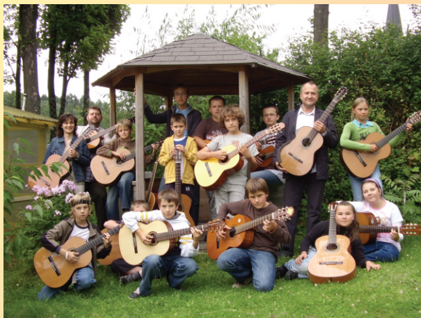
Uczestnicy II Letnich Warsztatów „Gitarra moja pasja”, Jedlina Zdrój 2008 r.