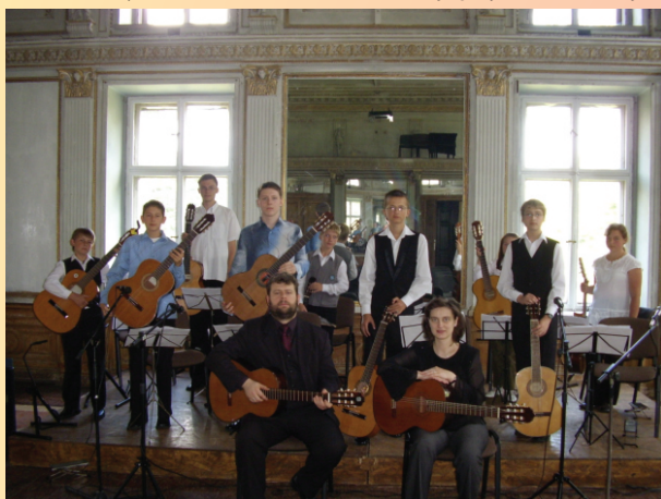
Koncert uczestników I Letnich Warsztatów „Gitarra moja pasja”, Jedlina Zdrój 2007 r.